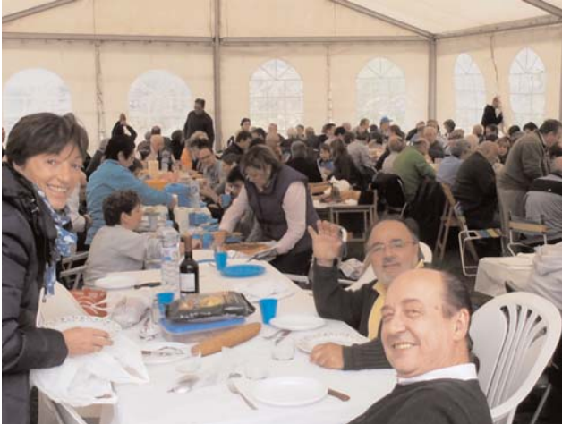
Comida de hermandad en el interior de la carpa.

pasar el resto de la jornada, se ha subsanado definitivamente con la feliz implantación de una hermosa carpa, que además de aportar su impecable geometría, nos acoge a todos juntos en su interior y nos garantiza la convivencia en grupo pese a posibles intemperies, chaparrones y calores, que de todo ha habido en los últimos años; en varias ocasiones hemos tenido que trasladar el campamento a lugares próximos, que pese a su hospitalidad, siempre nos han decepcionado porque lo que deseamos todos los asistentes ese día es reunirnos para comer, beber, debatir y cantar arropados por el fantasmagórico escenario de nuestro devastado pueblo. Además en este espacio es donde la jota, al confundirse con el paisaje, llega más hondo y aúna los recuerdos de todos en una mágica armonía de guitarras, laúdes, bandurrias y gargantas con la arqueología de las piedras, a las que en ese momento todos ponemos nombre y apellidos.