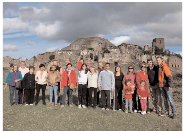
Los Sánchez acudieron a Esco casi al completo.

Por repetitivos que sean estos actos y estos gestos, los esperamos todos los años con el renovado espíritu del ¿qué pasará?, ¿quién vendrá?, ¿habrá alguna sorpresa?, ... ¿me tocará el jamón?. Y todos los años hay cumplida respuesta a cada uno de estos interrogantes y, al marcharnos, todos nos quedamos con las ganas de volver a formularnos las mismas preguntas el próximo 1 de Mayo. Pero en este momento, el de la despedida, ya falta menos y la anónima maquinaria que ha hecho posible clausurar la fugaz jornada, comienza a funcionar para garantizar el desarrollo de una nueva reunión al cabo de un año. Las cosas no funcionan por sí solas, lo sabemos todos, aunque con frecuencia olvidamos, mejor dicho no consideramos que hay un grupo de personas, casi siempre las mismas, que con entusiasmo, entrega y generosidad posibilitan la celebración de estas jornadas,... que tan solo son el mascarón de proa de todo el aparato que constituye la Asociación pro Reconstrucción de Esco. A todos ellos nuestro afecto y reconocimiento.