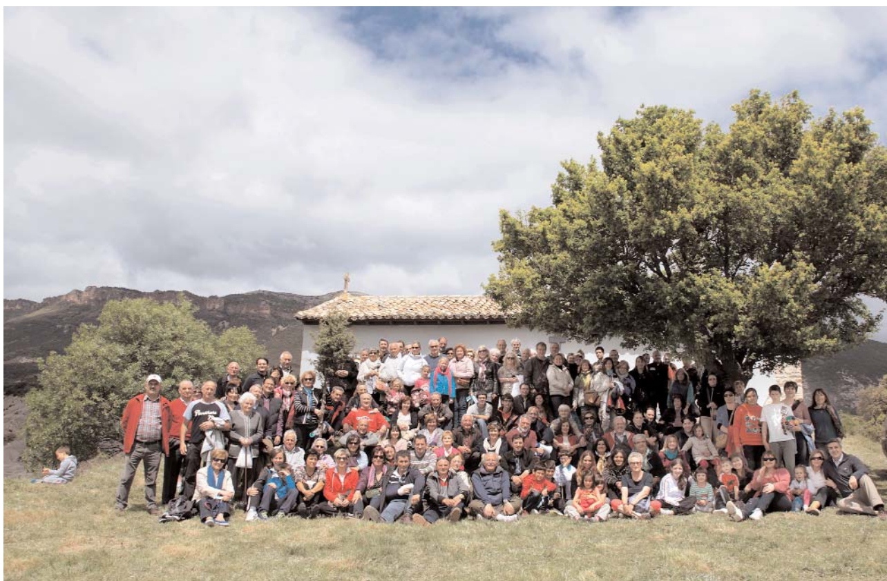
Asistentes al pasado encuentro de mayo, delante de la ermita de la virgen las Viñas.

La indisciplina y celeridad con que hasta hace poco invadíamos anárquicamente los espacios, intentando acomodar mobiliario y utensilios para