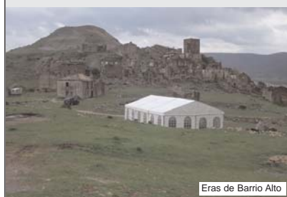
Eras de Barrio Alto