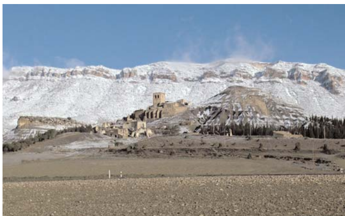
Fotografía tomada en Febrero de 2013.