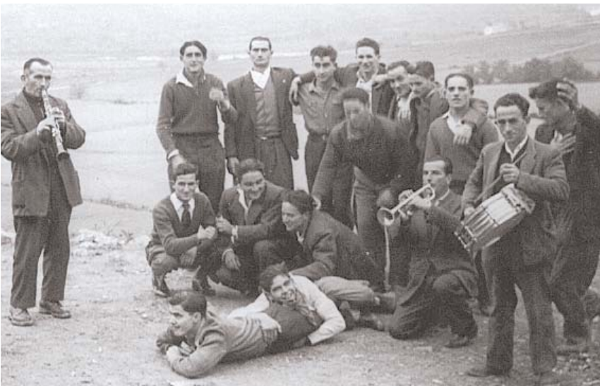
Herri bizia. Hustu aurretik, herri bizia zen Esco, eta besta anitz baziren. Argazkian herriko mutilak 1958. urteko jaietan. BERRIA