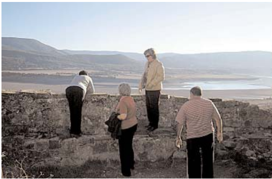
Esari so. Herriaren beheko aldean dagoen urtegiari begiratzen dio herriak.