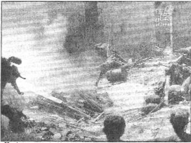
«Hemingway» fue herido en la batalla. Iriarte