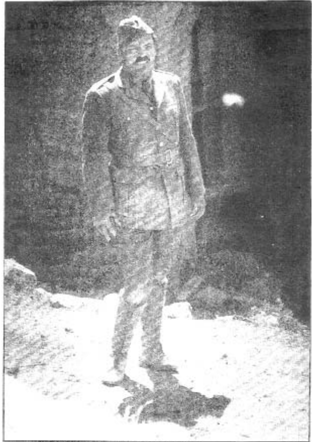
Stacy Keach, «Hemingway» en la guerra del 36.