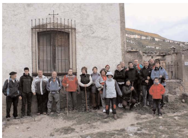
Domingo 7. El grupo junto a la capilla de Miramont.

Llegamos a este pueblo sobre las 14 h. y recorrimos los restos del mismo comprobando con pesar la ruina que afecta a lo que fue un floreciente caserío, dotado con una pequeña capilla para los oficios religiosos. Dimos por terminada la jornada y nos emplazamos en este mismo lugar como punto de partida para el día siguiente domingo.