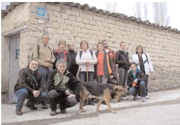
Día 6 de noviembre. Parada en Asso Veral

La niebla fue desapareciendo conforme iba avanzando la mañana y cuando iniciamos el camino hacia Miramont el sol brillaba con total intensidad.