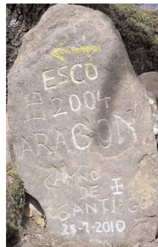
Mojón hecho por E. Guallar

Tras atravesar el Coscollar, llegamos a los Cerraos y realizamos el último tramo del Caminreal, y dado que la lluvia arreciaba nos dirigimos a la Virgen de las Viñas, donde la treintena de personas disfrutamos del aperitivo tradicional que ofrece nuestra asociación a base de tocino y longaniza. Con posterioridad, todos juntos, disfrutamos de una comida comunitaria con las viandas que aportó cada uno de los caminantes.